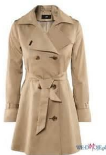
Płaszcz ok. 200 zł