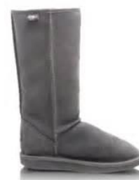
Emu 50-80 zł